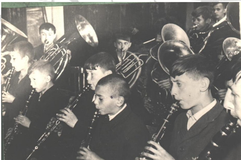
Рябинівський духовий оркестр під час виступу. 1968р