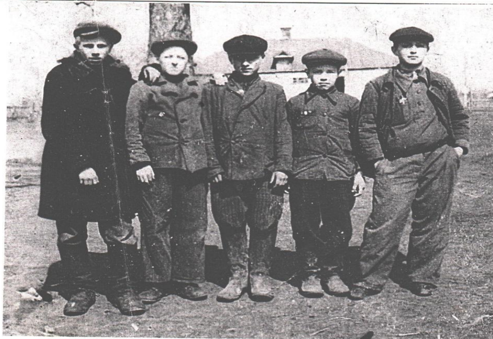
Сільська парубота – старорябинівські пацани, учні 7 класу Старорябинівської семирічної школи, в 1955 році.