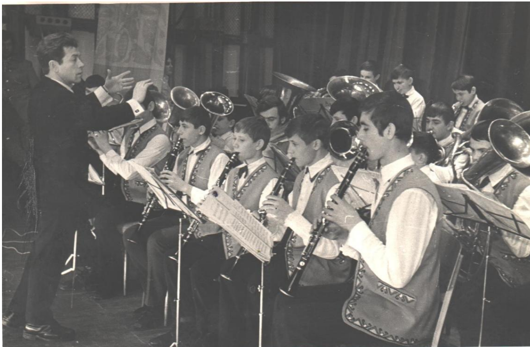
Виступ Великописарівського духового оркестру в м.Суми, 1976р.