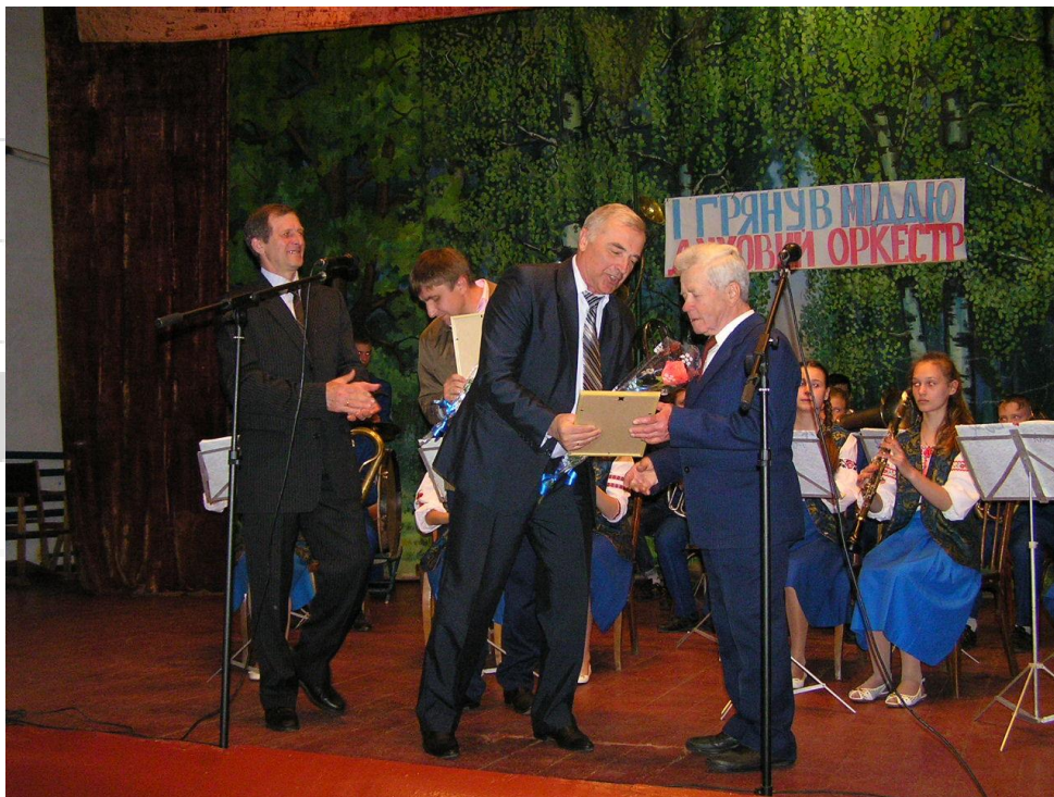
Нагороди після виступу духового оркестру. День селища Велика Писарівка, 2016р.