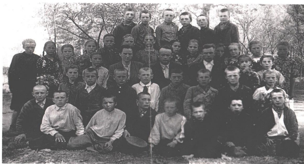
Старорябинівські "фронтвики", учні 4 класу, котрі щойно склали екзамен, – 19 травня 1952 року, – в Старорябинівській семирічній школі.