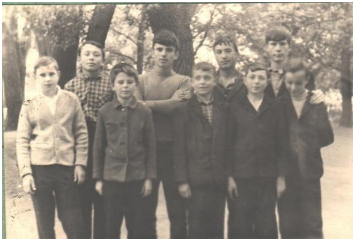
Перші учасники оркестру, 1966р.