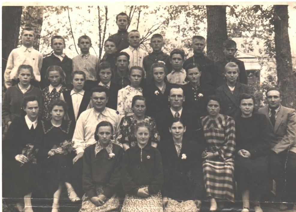
Фото на згадку після закінчення Старорябинівської семирічної школи, травень 1955р