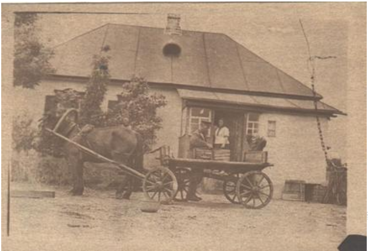
Виряджання сина Івана на роботу шахти Донбасу, літо 1958р.